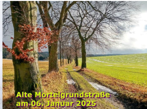
Alte Mörstelgrundstraße am 06. Januar 2025

Ab den 10. Januar strömte rückseitig einer markanten Kaltfront ein Schwall feuchter und kalter Polarluft nach Mitteleuropa der unter Hochdruckeinfluss gelangte. Die Schneehöhen erreichten am 12. Januar ihre maximale Höhe. Die Schneedecke wuchs in Zinnwald – Georgenfeld auf 24 cm (DWD) bzw. 38 cm (Wetterverein), in Deutschneudorf – Brüderwiese auf 37 cm, in Sayda auf 22 cm, in Marienberg auf 12 cm und auf den Fichtelberg auf 44 cm an. Bis einschließlich 14. Januar dominierte teils wolkiges, teil heiteres, ruhiges hochwinterliches Hochdruckwetter mit Dauerfrost bis in die Niederungen.