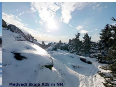
Medvedi Skala 925 m NN