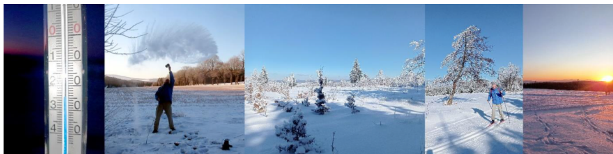
18. Februar, Höhepunkt der Hochwinterepisode, am Mortelgrund und Lesenska plan 921 m NN.

Minimal- und Maximaltemperaturen ausgewählter Stationen im Erzgebirge im Vergleich mit den beiden sächsischen Metropolen während der Hochwinterepisode.