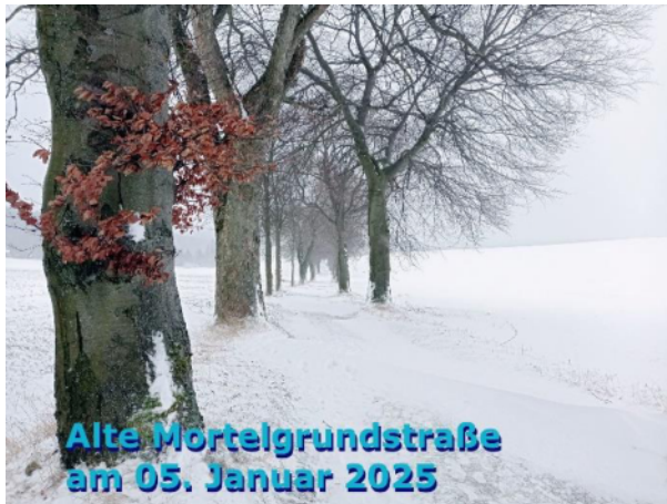
Alte Mörstelgrundstraße am 05. Januar 2025