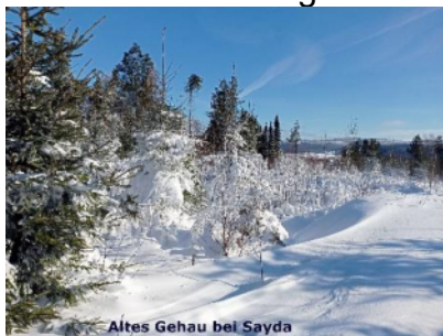
Altes Gehau bei Sayda

Ab den 10. Januar strömte rückseitig einer markanten Kaltfront ein Schwall feuchter und kalter Polarluft nach Mitteleuropa der unter Hochdruckeinfluss gelangte. Die Schneehöhen erreichten am 12. Januar ihre maximale Höhe. Die Schneedecke wuchs in Zinnwald – Georgenfeld auf 24 cm (DWD) bzw. 38 cm (Wetterverein), in Deutschneudorf – Brüderwiese auf 37 cm, in Sayda auf 22 cm, in Marienberg auf 12 cm und auf den Fichtelberg auf 44 cm an. Bis einschließlich 14. Januar dominierte teils wolkiges, teil heiteres, ruhiges hochwinterliches Hochdruckwetter mit Dauerfrost bis in die Niederungen.