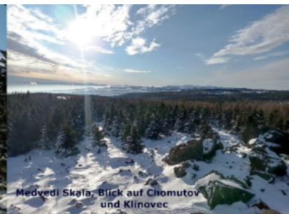
Medvedi Skala, Blick auf Chomutov und Klinovec

Das langgestreckte Hochdruckgebiet reichte vom Atlantik bis zum Baltikum und lag südlich unserer Bundesländer. Die Tiefdruckgebiete zogen nördlich des Hochs über Fennoskandien, so dass am 15. und 16. Januar deren weit ausgreifende Warmfronten den Regionen bis zum nördlichen Alpenrand vorübergehend neblig trübes Wetter mit feuchter, milder Luft, Sprühregen und Temperaturen um oder etwas über Null Grad brachten. Ende der zweiten Dekade verlagerte sich das kräftige Hoch etwas nach Osten. Damit sickerte sehr trockene aber milde Luft ein. In den Niederungen lag zäher Nebel mit Nebelnässen und Temperaturen knapp über Null Grad, in den Hochlagen der Mittelgebirge und Alpen dominierte klares, sehr sonniges, trockenes Wetter mit teilweise zweistellig positiven Tagestemperaturen und mäßigen Nachtfrosten. Der Höhepunkt der Inversionswetterlage war am 19. Januar. In Treuen (Vogtland) wur-