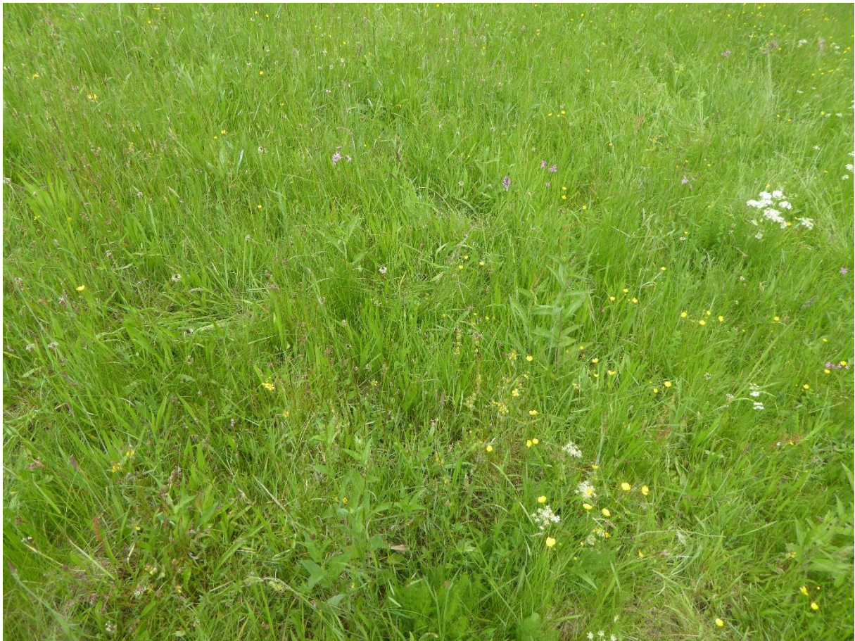
Draufsicht auf Vegetationsaufnahme mit Blick nach Nordwest