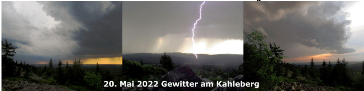
20. Mai 2022 Gewitter am Kahleberg

Nach den Eisheiligen bildete sich zwischen der Südwestflanke eines kräftigen Hochdruckgebietes bei Fennoskandien und hohem Druck über Südeuropa bis Nordafrika und bis zu den Azoren eine Konvergenzlinie, die für unbeständiges Wetter sorgte. Bis zum Ende der zweiten Maidekade bestimmten heiße und feuchte Luftmassen unsere Witterung. Am 20. Mai erreichte die Hitzewelle ihren Höhepunkt. Die Tagestemperaturen erreichten in ganz Mittel-, West- und Südeuropa Werte um 30 °C, auf der Iberischen Halbinsel bis zu 40 °C. In Sachsens beiden Metropolen erreichten diese knapp 30°C, ansonsten stiegen die Temperaturen in Sachsen auf Werte um 25 °C an. In den Abendstunden entluden sich einzelne Gewitter. Von Rheinland – Pfalz über NRW bis Niedersachsen und Brandenburg traten schwerste Unwetter mit Hagel und sechs durch den DWD amtlich bestätigten Tornados auf. In Paderborn, Lippstadt und Höxter verursachen die Tornados schwerste Verwüstungen.