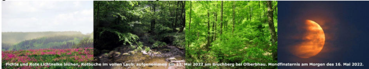
Fichte und Rote Lichtnelke blühen, Rotbuche im vollen Laub, aufgenommen am 13. Mai 2022 am Bruchberg bei Olbernhau. Mondfinsternis am Morgen des 16. Mai 2022.

Während der Eisheiligen erfolgte bis in die Kammlagen eine sehr rasche Laubentfaltung, das Kronendach schloss sich. Ebenso erreichte der Höhepunkt der Apfelblüte die Kammlagen und bei Fichte war eine extrem starke Blüte zu beobachten. Die Berglagenwälder wurden im wahrsten Sinne des Wortes in riesige gelbe Wolken von Fichtenpollen eingehüllt.