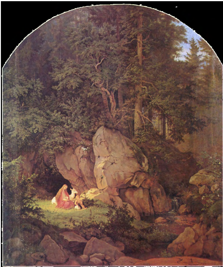
Genoveva in der Waldeinsamkeit, Gemälde von Adrian Ludwig Richter, 1841

Die Pfingst-Nelke ist eine rosablühende, angenehm duftende, überwintert grüne, ausdauernde krautige Pflanze und erreicht Wuchshöhen zwischen 10 und 20 Zentimetern. Sie ist durch den Polsterwuchs, durch kleine mit einer Wachsschicht überzogenen Blättern und mit Festigungsgewebe versehenen Leitbündeln an trockene und heiße Standorte angepasst. Es werden nur wenige Zentimeter lange Fortsetzung auf S.5