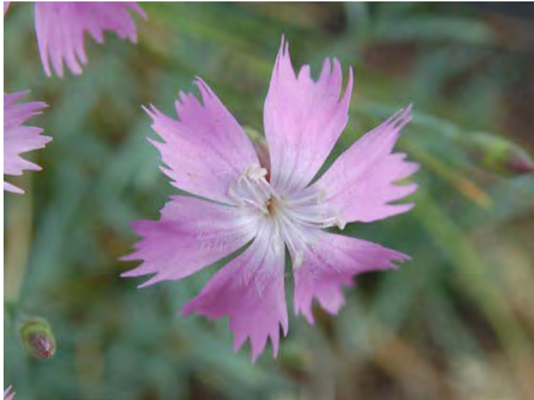
Pfingst-Nelke | Foto: U. Klausnitzer

Fortsetzung von S. 4 Wurzeln gebildet, dies ermöglicht der Pfingst-Nelke auf sehr flachgründigen Böden zu wachsen. Die Pfingst-Nelke gehört zu den größten Seltenheiten Mitteleuropas. Sie ist ein zentraleuropäischer Endemit (eine Art, die außerhalb dieses Gebietes nirgends vorkommt). Ersatzbiotope werden i.d.R. nicht besiedelt, so dass die verbliebenen Populationen kleinflächig sind.