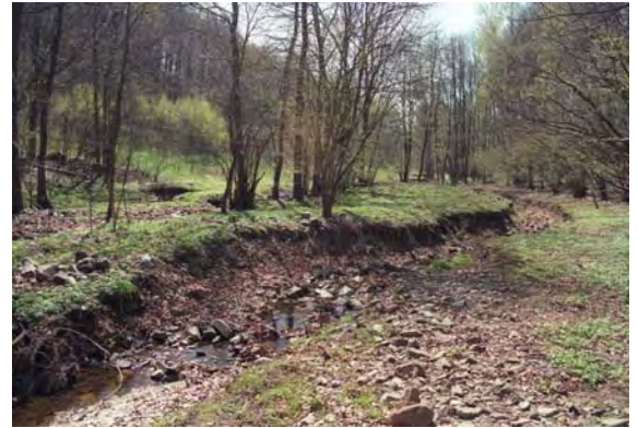
Ergebnis der Gewässerdynamik: Ein natürlich umgestalteter Gewässerabschnitt der Bahre mit Bachgabelung, Schotterfläche, Flach- und Steilufer sowie Uferabbrüchen

raturen und die lange Trockenheit im vergangenen Jahr auch hier ihre Spuren hinterlassen haben. Der Blühaspekt der Mähwiesen fiel deutlich geringer aus als in den Jahren zuvor. Die Bahre und ihre Seitenbäche waren teilweise trocken-gefallen. Die Grünland-Lebensraumtypen