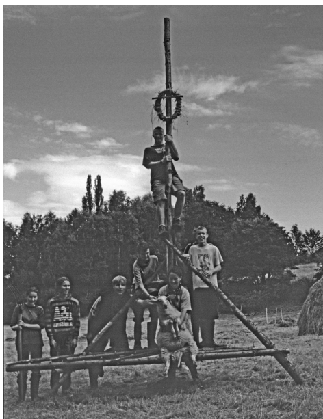
Dippser und Altenberger Gymnasiasten beim Heulager 1997

Seit 15 Jahren gibt es die Madagaskar AG am Altenberger Gymnasium. Die Schülerinnen und Schüler engagieren sich nicht nur für Partnerschaftsprojekte mit einer madagassischen Jugend-Umwelt-gruppe, sondern sind von Anbeginn auch bei Naturschutzaktionen im Ost-Erzgebirge aktiv. 2020 organisierten wir das erste Madagaskar-AG-Camp im Bärensteiner Bielatal, als Nebenprogramm des Heulagers. Dessen erste Woche lag damals noch vor den Ferien, die Altenberger Schülerinnen und Schüler bekommen für die Zeit schulfrei - ein Versuch, wieder jugendlichen Nachwuchs aus der Region ans Heulager heranzuführen.