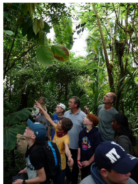
Madagaskar-AG-Camp beim Heulager 2020, Exkursion Botanischer Garten Teplice