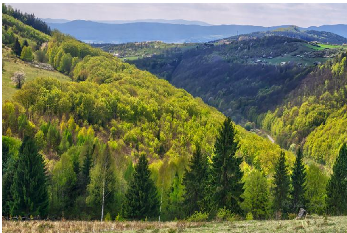
9:45 – 11:15 – Alte Riesen in Hrochotská dolina, PP Bátovský balvan